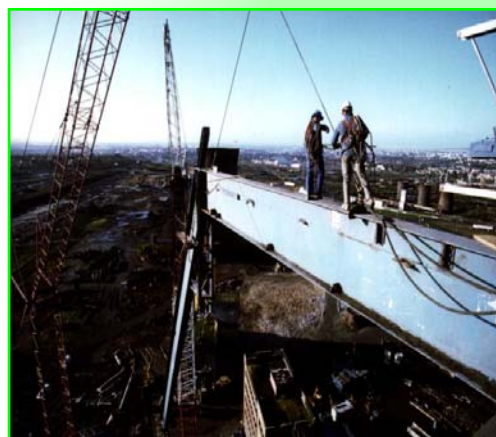
Transfert de l'acierie d'Unimétal Normandie vers Handan en Chine 1994 - 1995